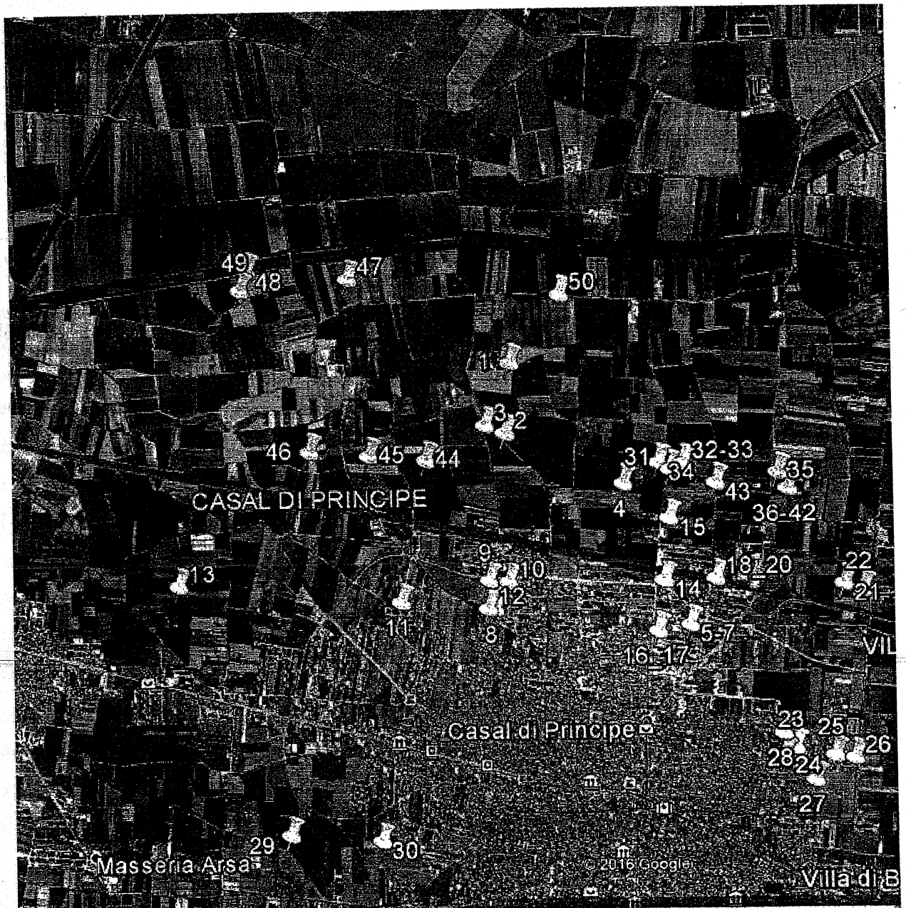
Fig.1: Localizzazione delle 50 aziende analizzate.

I campioni di suolo sono stati consegnati al laboratorio della sezione Scienze chimico agrarie del Dipartimento di Agraria. I campioni sono stati essiccati all'aria, quartati con il metodo cone and quarter (DM 13/9/99), setacciati a 2 mm e conservati in barattoli di plastica. Da ogni campione è stata prelevata un'aliquota di 5 g che è stata consegnata al laboratorio del Dipartimento di Chimica dell'Università di Napoli Federico II per la determinazione del contenuto totale di EPT (Arsenico, Berillio, Cadmio, Cobalto, Cromo totale, Nichel, Piombo, Rame, Selenio, Tallio, Vanadio, Zinco).